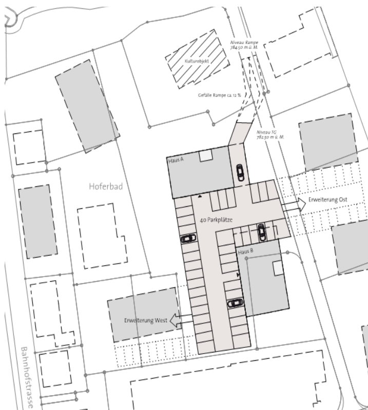
Anordnung Tiefgarage (unbestimmter Massstab)

Eine Tiefgaragenzufahrt ab der Poststrasse bzw. unter den Gleisanlagen kann aus Kostengründen kaum in Frage kommen. Eine Zufahrtsoption im Bereich des bestehenden Hoferbadweges wurde geprüft. Dazu ist die Untergeschoss-situation analysiert worden und es kann bestätigt werden, dass die geforderte Anzahl Tiefgaragenparkplätze realisierbar wäre. Die Tiefgarage könnte allenfalls künftig in Richtung Norden und Osten erweitert werden und zusätzliche Gebäude erschliessen. Die Lastwagenzufahrten zu den Gewerbebetrieben von Daniel und Hansruedi Aeschbacher müssen auch künftig gewährleistet bleiben.