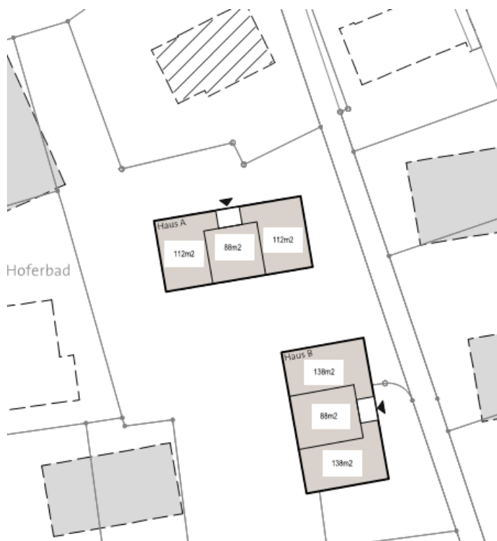
Schemagrundriss mit 3-Spännern (unbestimmter Massstab)

Vorgenannte Angaben bilden die Basis für die nachfolgenden Berechnungen.