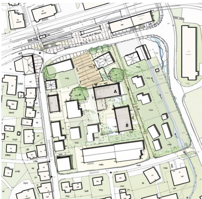
Überbauungskonzept (unbestimmter Massstab)

In einem Workshopverfahren wurde folgendes Ergebnis für das Baurechtsgrundstück D2373 (umfassend Parzellen Nr. 35, 1'050 und Teile von 1'085 (35m 2 ) ermittelt. Es könnten zwei Neubauten (MFH A und MFH B) erstellt werden, wobei das nördlich gelegene Gebäude aus Rücksicht auf das geschützte Stammgebäude dreigeschossig und das südlich gelegene Gebäude viergeschossig ausgeführt werden könnte. Die so entstehende Hofsituation ermöglicht eine hohe Wohnqualität trotz der rückwärtigen Lage. Die Hauptnutzung soll Wohnen für Jung und Alt sein. Stilles Gewerbe oder allenfalls ein Einkaufsladen für den täglichen Bedarf im Erdgeschoss sind ebenfalls denkbar.