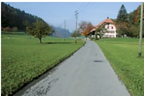
Verkehrsarme Nebenstrasse ohne Trottoir, Fuss- und Radweg