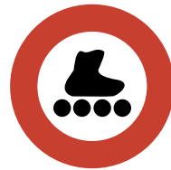
Verbot für fäG