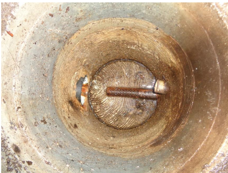
Quellschacht Restaurant Wilden Mann

Schüttung: 0.2 l/min El. Leitfähigkeit: 243 µS/cm Temperatur: 5.3 °C