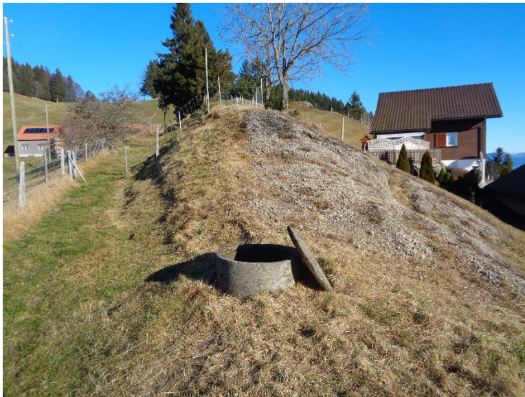
Quellschacht Restaurant Frohe Aussicht