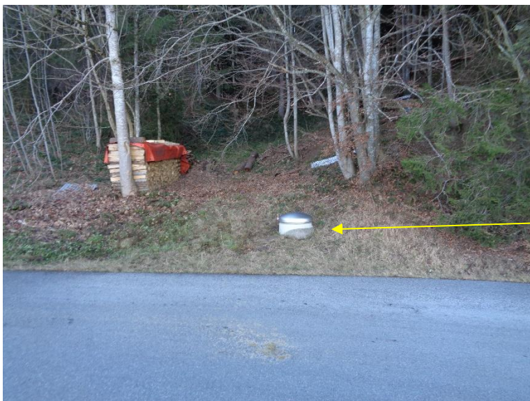
Quellschacht Restaurant Wilden Mann