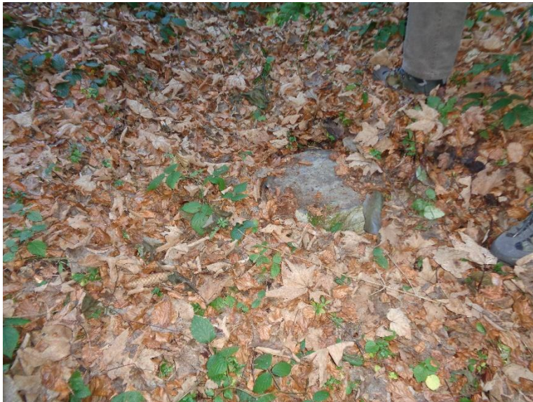
Quellschacht Restaurant Wilden Mann

Im Grundbuch ist kein Quellenrecht eingetragen.