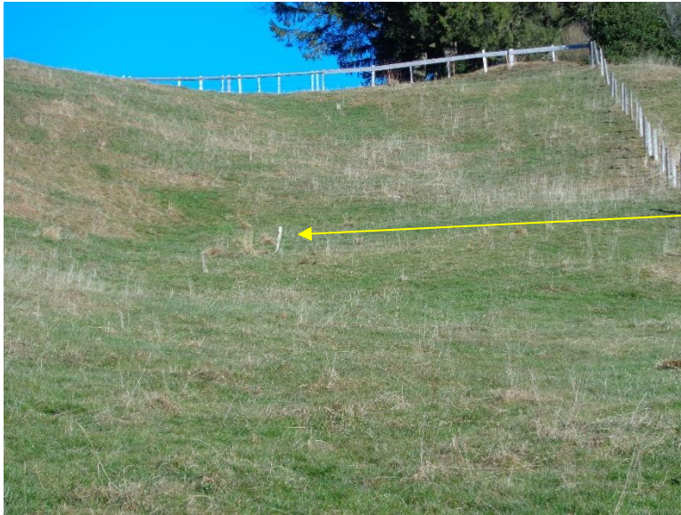
Quellfassung Restaurant Frohe Aussicht )

Fassungsstandort ist mit Holzpfahl markiert