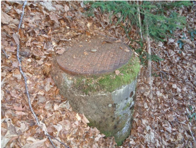
Quellschacht Restaurant Wilden Mann

Das Quellenrecht ist im Grundbuch für die Parz. Nr. 548 wie folgt eingetragen: 1970a208, Last: Quellenrecht Zugunsten Grundstück Nr. 564; 18.09.1970 Beleg 4.208