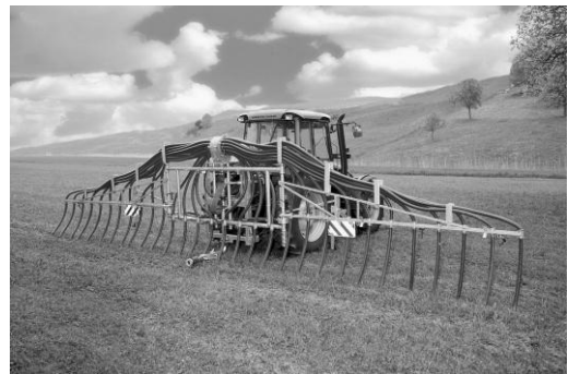
Figur 2 Schleppschlauchverteiler

Gute Ausbringtechnik: Mindestens 50% der Ammoniakbelastung der Luft stammen aus der Landwirtschaft – sie können mit richtiger Ausbringtechnik stark reduziert werden. Gegenüber dem Prallteller geht bei der Ausbringung mit dem Schleppschlauch weniger Ammoniak an die Luft verloren. Die Geruchsbelästigungen sind kleiner.