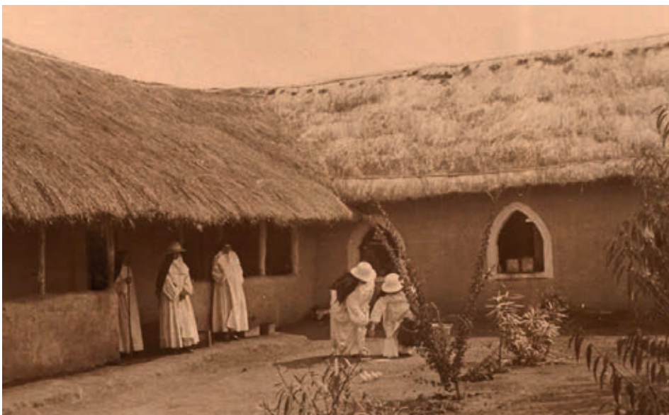
In der Benediktiner-Abtei Peramiho