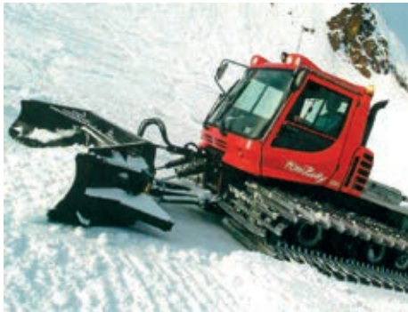
So sieht die zukünftige Oberegger Pistenwalze aus, ein Pisten-Bully 200.

ken an. Ein umfangreiches Sponsoring-Konzept kommt ab sofort zum Einsatz, damit ein möglichst grosser Teil der Investition gedeckt werden kann. Es beginnt nun die Suche nach Hauptsponsoren, welche sich mit 5'000 Franken an der Pistenwalze beteiligen und dafür ein Paket an Gegenleistungen erhalten. Auch für Co-Sponsoren wurde ein Päckli geschnürt. Anlässlich der Pistenfahrzeug-Taufe vom Samstag, 27. Oktober 2018, gibt es diverse kleine Möglichkeiten der Mitfinanzierung vor Ort.