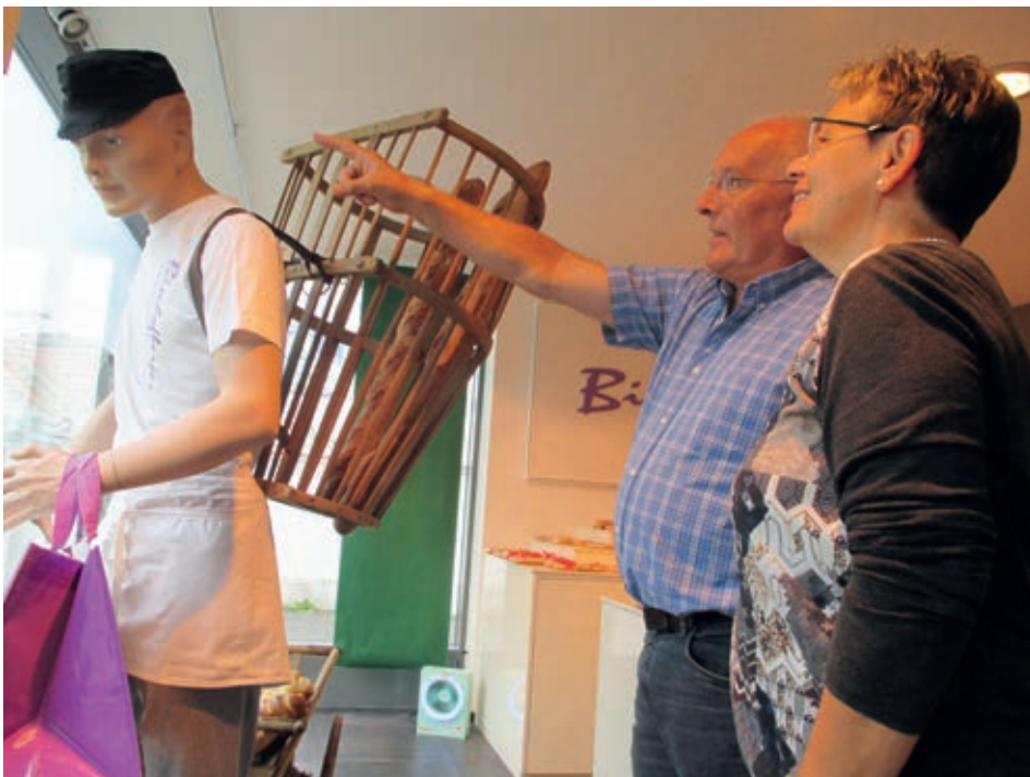
Der Brotverträger in Obereg wird vielbeachtet und weckt Erinnerungen an frühere Zeiten mit einer aus heutiger Sicht unglaublichen Vielzahl von Bäckereien.