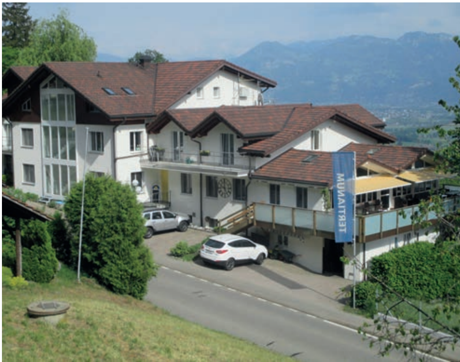
Das aussichtsreich gelegene Alters- und Pflegezentrum Sonnenschein in Mohren ist 20 Jahre alt.