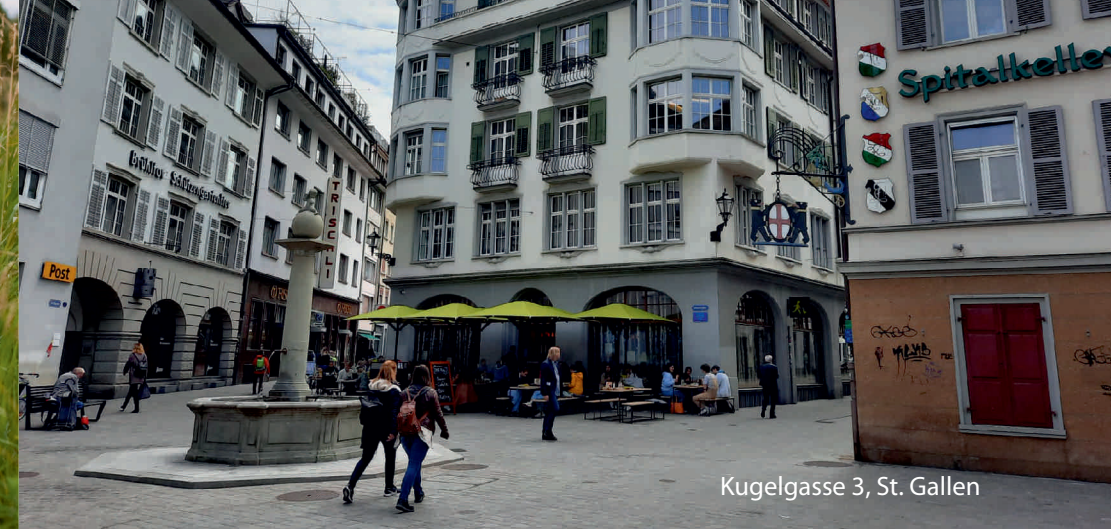
Kugelgasse 3, St. Gallen